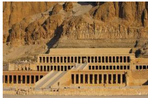
ハトシェプスト女王葬祭殿

ファラオ史上唯一エジプトを統治した女王であるハトシェプストの葬祭殿や、ツタンカーメンの墓がある王家の谷など、エジプトを代表する見逃せない壮大な遺跡の数々が存在します。